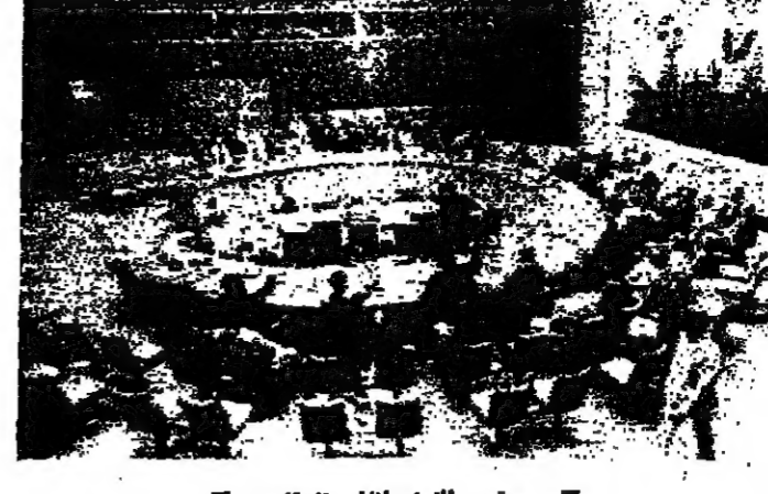
مجلس الامن اثناء انعقاده

تخدير مصري من استعمار المشرق وقال القذافي المصري: انه اذا لم يجرى التمسك على موقف اسرائيل، وانما في حقها في السلم، ويجب عليها ان تصبر على ذلك ليس بمجرد الكلام، بل بالفعال.